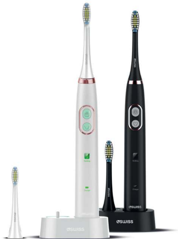
Inteligentna szczoteczka soniczna 4Swiss ST212 Sensitive Care